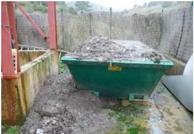
Ejemplo del “buen funcionamiento” y gestión de los lodos que se extraen del proceso de depuración, que permanecen en el suelo y que son dispersados por la crecida del río por todo el cauce del Río Lobos.

Ante tales hechos el Comisario de la Confederación afirma que “ La EDAR está perfectamente bien ” y el Alcalde de Hontoria que funciona bien pero que puntualmente no se puede acceder con vehículos cuando crece el río.