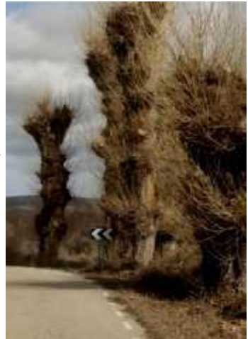
Chopos de Aldeaseñor tras la poda

En el mes de febrero de 2013 en la localidad de Reznos se realizó una corta de chopos trasmochos, que fue denunciada por ASDEN ante la Confederación Hidrográfica del Ebro y la Consejería de Medioambiente de la Junta de CyL. La Confederación abrió un expediente sancionador, y la Junta de CyL bajo excusas sin ningún valor jurídico las archivó. Al menos hemos evitado la corta de todos los árboles y se impuso la obligación de plantar chopos autóctonos que reempla-