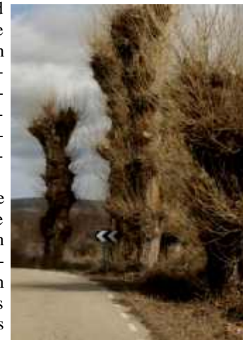
Chopos de Aldeaseñor tras la poda

En el mes de febrero de 2013 en la localidad de Reznos se realizó una corta de chopos trasmochos, que fue denunciada por ASDEN ante la Confederación Hidrográfica del Ebro y la Consejería de Medioambiente de la Junta de CyL. La Confederación abrió un expediente sancionador, y la Junta de CyL bajo excusas sin ningún valor jurídico las archivó. Al menos hemos evitado la corta de todos los árboles y se impuso la obligación de plantar chopos autóctonos que reempla-