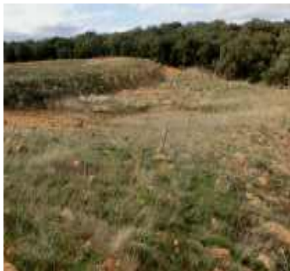
Zona excavada previamente cubierta por un encinar como el del fondo de la foto

En la memoria del 2011 exponíamos que habíamos realizado una denuncia por una presunta corta y extracción de grava en el paraje El Viso (Soria capital) en suelo rustico con especial protección. Según la Junta de CyL, no era una extracción de grava y tenía autorización de aprovechamiento forestal. El Ayuntamiento abrió un expediente sancionador, imponiendo una sanción de 5.000 euros y restauración de la zona a su estado natural previo. A principios de 2014 la zona estaba todavía sin restaurar y es de esperar que en próximos meses se produzca la misma, bien por el infractor o subsidiariamente por parte del Ayuntamiento.