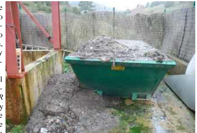
Ejemplo del “buen funcionamiento” y gestión de los lodos que se extraen del proceso de depuración, que permanecen en el suelo y que son dispersados por la crecida del río por todo el cauce del Río Lobos.

Ante tales hechos el Comisario de la Confederación afirma que “ La EDAR está perfectamente bien ” y el Alcalde de Hontoria que funciona bien pero que puntualmente no se puede acceder con vehículos