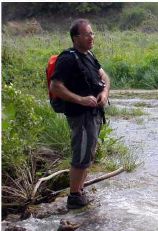
Excursión al Río Añamazas. Mayo 2007

El resultado han sido varias Sentencias judiciales que han generado jurisprudencia, y por lo tanto pueden invocarse en otras causas semejantes.