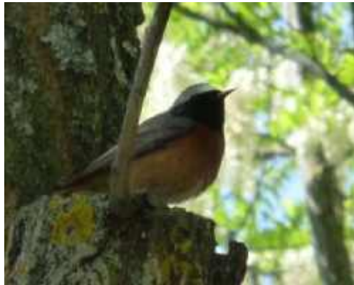
El colirrojo real ( Phoenicurus phoenicurus ). Vulnerable. Real Decreto 139/2011. Junio. Parque del Castillo.

El Ayuntamiento de Soria no ha contestado a ninguna de nuestras solicitudes y propuestas, pero paradójicamente este año 2014, ha anunciado la presentación de la candidatura del Término de Soria a recibir el Título de Reserva de la Biosfera, sin haber abierto primero un proceso de participación activo, transparente y serio.